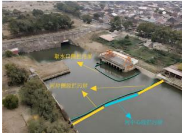
小舜江老河道应急取水口示意图

净水型水生态系统修复试验区域 3000 平方米（为取水口拦污网至河道拦污网之间区域），将拦河浮体替换成专业拦污屏。