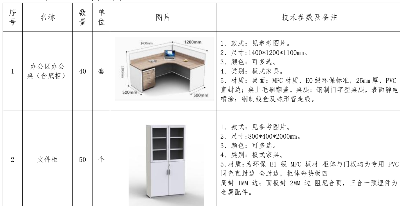
原垂钓中心家具清单 1.2