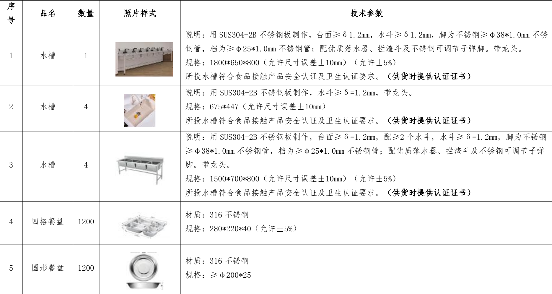
附件：厨房培训设备清单及技术参数