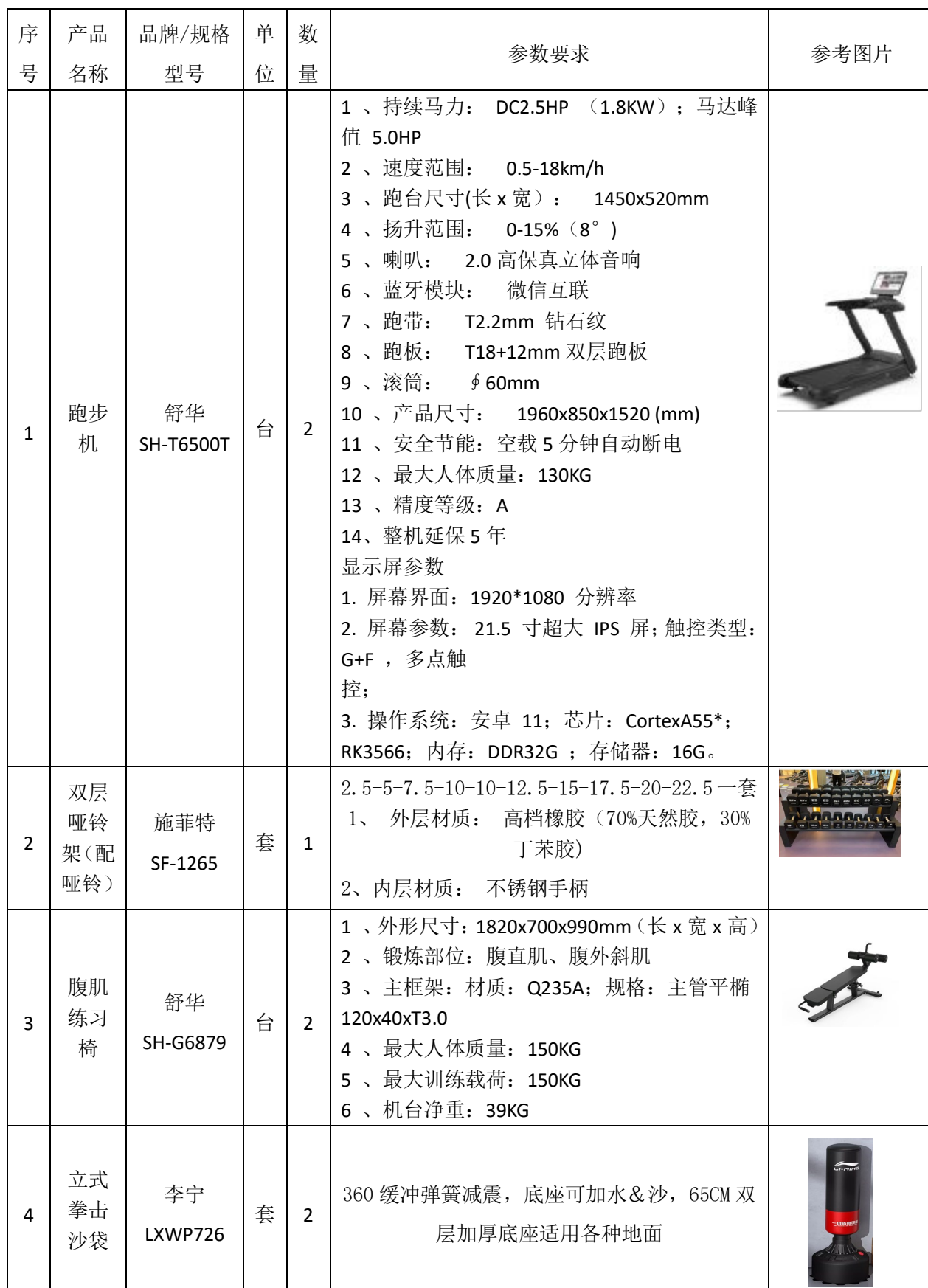
关于镜湖公用大楼“职工之家”设施采购项目（健身器材）清单